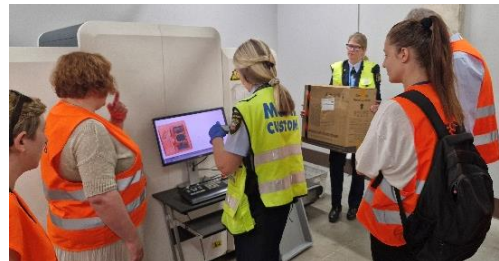
Фигура 1 Митнически проверки при взаимното посещение в Латвия

Финансирано от Европейския съюз. Изразените възгледи и мнения обаче са само на автора(ите) и не отразяват непременно тези на Европейския съюз или Европейския съвет за иновации и Изпълнителната агенция за МСП (EISMEA). Нито Европейският съюз, нито предоставящият орган могат да носят отговорност за тях.