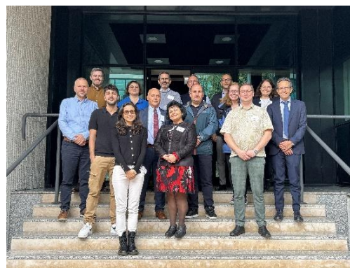
Фигура 2 Групова снимка от взаимното посещение в Италия